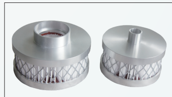
进出风过滤器(选配)