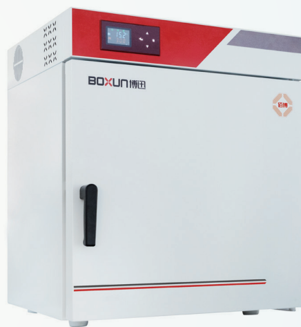
BGZ (高温300°C) 系列

上海博迅医疗生物仪器股份有限公司 Shanghai Boxun Medical Biological Instrument Corp