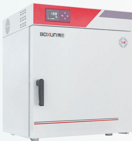
GZX (高温300°C) 系列